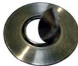
ディスク開口状態